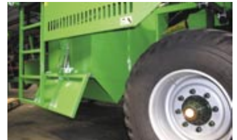
Steinbunker, hydraulische Steuerung

Dank des speziellen Trennsystems der Spirit 4100 können Sie diese Maschine auch bei steinigem Boden einsetzen. Der umlaufende Fingerkamm (serienmäßig) garantiert eine ausgezeichnete Trennung von Kartoffeln, Steinen und Kluten. Wenn Sie unter ganz schweren Umständen roden müssen, ist es möglich die Spirit mit einem Steinabscheidungsmodul zu versehen; eine Bürste und ein spezielles Igelband gewährleisten eine noch effizientere schonende Behandlung des Produktflusses.