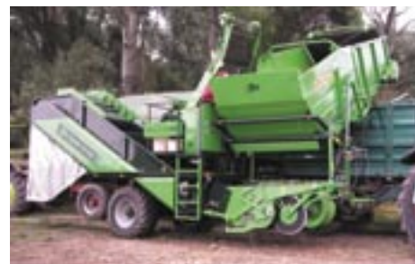
Überladehöhe bis 3,8 m