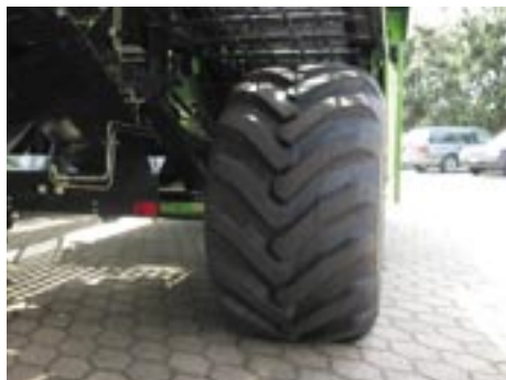
Reifen 600/50 22.5