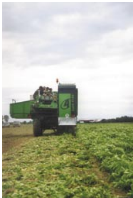
Der perfekte Roder für früh Kartoffeln!

AVR bvba Meensesteenweg 545, 8800 Roeselare, Belgien Tel +32 (0)51 245566 Fax +32 (0)51 229561 E-mail info@avr.be Internet www.avr.be